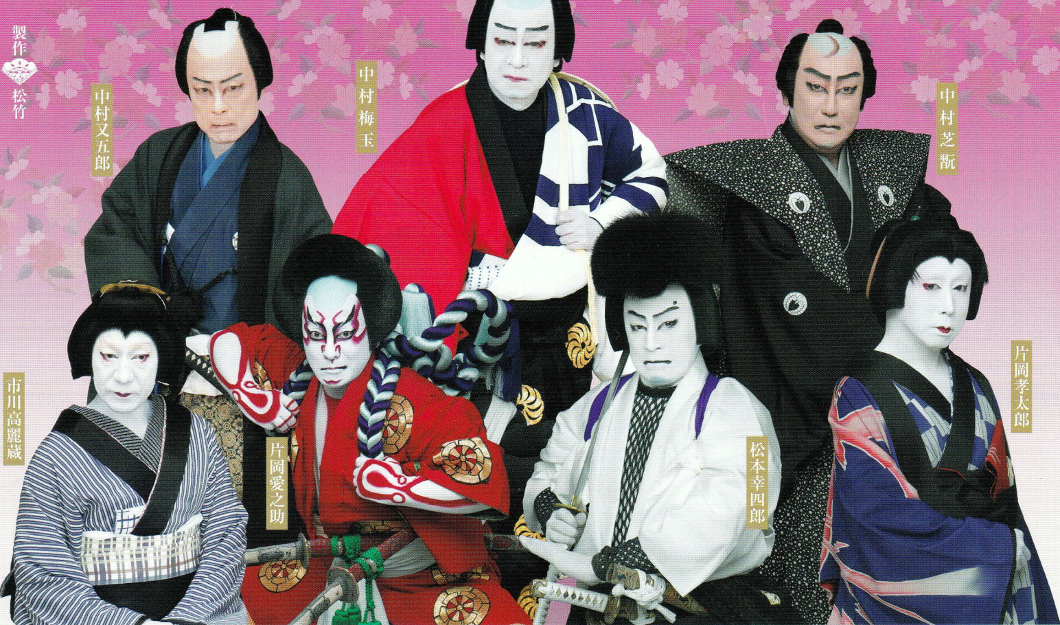
中村又五郎 中村梅玉 中村芝翫 市川高麗蔵 片岡愛之助 松本幸四郎 片岡孝太郎